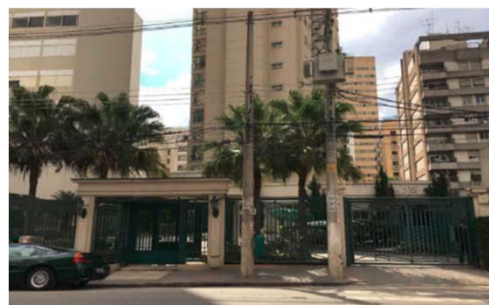
Rua Pamplona, 1808 - Jardim Paulista