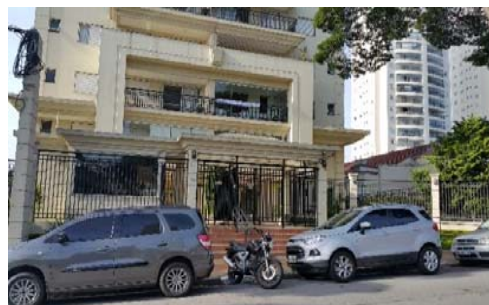
Rua Lord Cockrane, 26, São Paulo