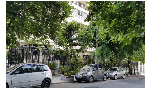
Rua Teodoro de Beaurepaire, 197